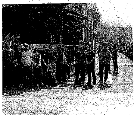
di Chiavari di Tributi Italia, a destra il cartello

i di Tributi Italia avevano l'intenzione di salire sul tetto